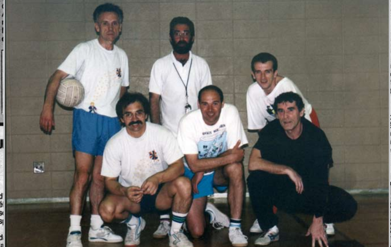
lieu fréquentant et le professeur élève.

PAGE 2 - PROGRÈS DE SAINT-LÉONARD - MARDI 26 AOÛT 1986