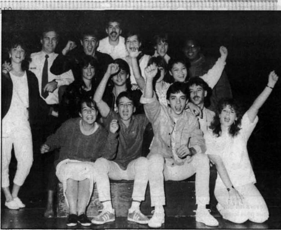
"Dégèle c'est au boutte", semblent vouloir dire les interprètes de la pièce à notre photographe.

"C'est vraiment de cette façon que cela se passe, de dire Caroline. Au début, ils essaient pour le "trip" et ensuite ils s'accrochent et éprouvent de la difficulté à s'en sortir".