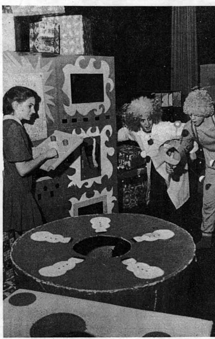
Une scène de la pièce MONOCADEAU, photographiée dernièrement lors d'une répétition.

Alors si vous avez envie de rencontrer le professeur Tournébelle, jalouse, la Monocaudeau et bien d'autres... soyez au rendez-vous le 8 décembre prochain.