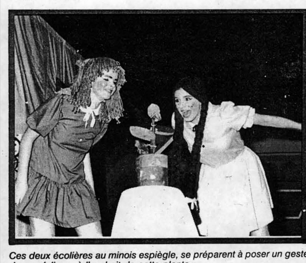
Ces deux écolières au minois espiègle, se préparent à poser un geste de vandalisme à l'endroit de cette plante.

Bonne chance au Nouvel An! Les élèves de la Polyvalente Antoine-de-Saint-Exupéry ont participé à un concours de talents. Les gagnants ont été récompensés et les autres ont aussi eu de beaux moments. Les élèves de la Polyvalente Antoine-de-Saint-Exupéry ont participé à un concours de talents. Les gagnants ont été récompensés et les autres ont aussi eu de beaux moments. Les élèves de la Polyvalente Antoine-de-Saint-Exupéry ont participé à un concours de talents. Les gagnants ont été récompensés et les autres ont aussi eu de beaux moments.